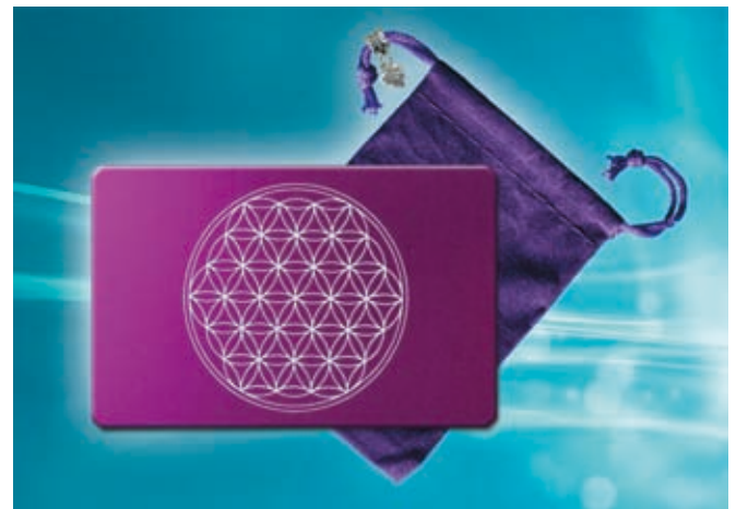
Abb. Teslaplatte „Blume des Lebens“

Energie und Information sind die Themen des neuen Zeitalters. Ihre elementare Wichtigkeit für die Menschheit hatte bereits vor 150 Jahren der geniale Physiker Nikola Tesla vorausgesehen. Mit 26 Jahren machte er seine erste revolutionäre Erfindung. Dies geschah, gleich nachdem er bei einem Spaziergang im Budapester Stadtpark einem Freund eine Passage aus Goethes „ Faust “ rezitierte. Dabei erschien ihm augenblicklich die Vision des magnetischen Drehfeldes vor Augen. Damit legte Nikola Tesla den Grundstein für die Nutzbarmachung des Wechselstromes. Tesla ließ sich in der Folge über 700 Erfindungen patentieren. Nach der Fertigstellung seines gigantischen Wasserkraftwerkes an den Niagarafällen, setzte er sich vermehrt mit höheren Energieformen im Universum auseinander. Er erkannte die Wichtigkeit der überall vorhandenen kosmischen Energie. So prophezeite er: „Wenn die Wissenschaft beginnt, sich mit nicht-materiellen Dingen zu beschäftigen, wird sie in 10 Jahren einen Fortschritt machen wie in 2000 Jahren.“